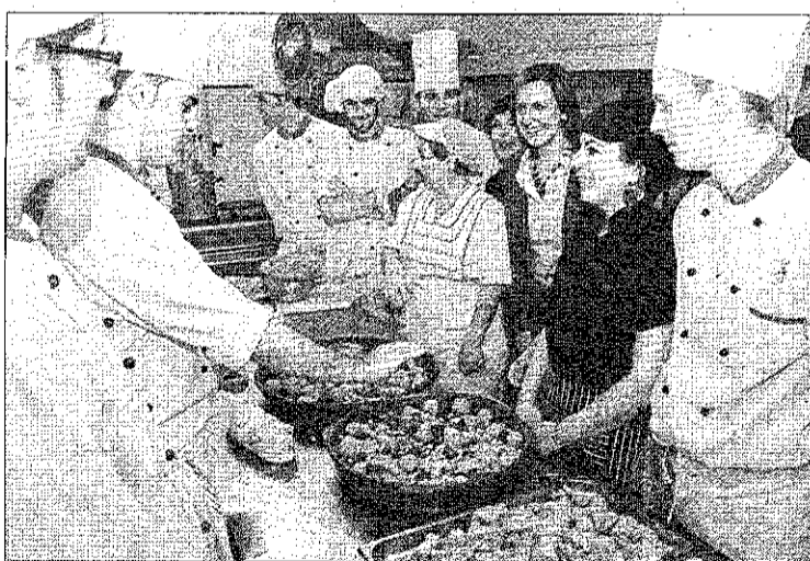
La alcaldesa, ayer, en las jornadas gastronómicas.

El subtramo de Valencia-Albuixech, de 6,3 kilómetros, con un importe de licitación de 149.195.919,3 euros y un plazo de ejecución de 24 meses, discurre íntegramente por la provincia de Valencia, a través de los términos municipales de Alboraya, Meliana, Foios, Albalat dels Sorells y Albuixech.